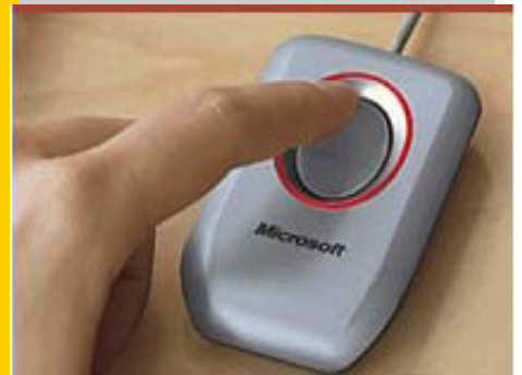
Fingerprintsensor (USB) + Software: 469,00 € + MwSt

Der Clou: jeder Verkäufer muss sich nur an einer Kasse registrieren und seine Fingerdaten wandern automatisch an alle übrigen Kassen - so baut sich eine biometrische Datenbank im gesamten Unternehmen ganz von selbst auf.